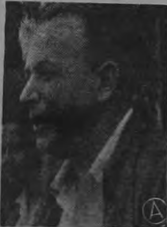
Don Francisco J. Orlich